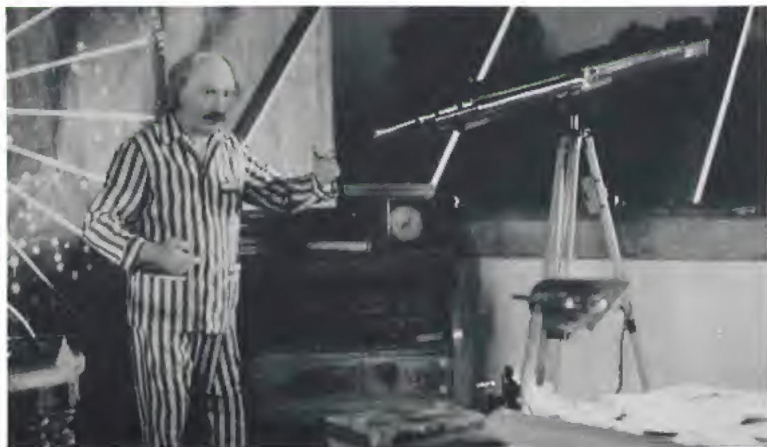
Fernando Fernán Gómez